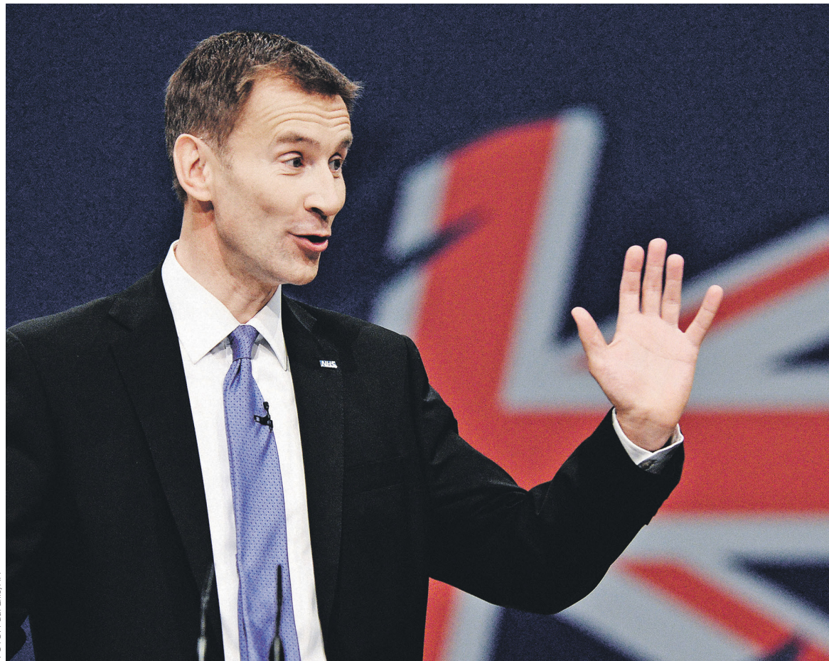
Прогресс британского МИДа на некоторых региональных направлениях — особенно в отношении русского и арабского языков — оставляет желать лучшего. На фото: министр иностранных дел Великобритании Джереми Хант

С 2013 года у британского МИДа есть собственная академия, обучающая иностранным языкам; доля специалистов ведомства, говорящих на иностранных языках, выросла с 2016 года, однако прогресс на некоторых региональных направлениях оставляет желать лучшего, утверждает в документе. «Мы довольны результатами в плане владения мандаринским диалектом китайского языка, однако обеспокоены показателями в отношении русского и арабского», — отмечается в докладе. Форин-офис не должен допустить ситуации, когда из-за нехватки ресурсов на службу в другие страны отправляются дипломаты, не прошедшие должной языковой подготовки, предупреждает комитет по иностранным делам.