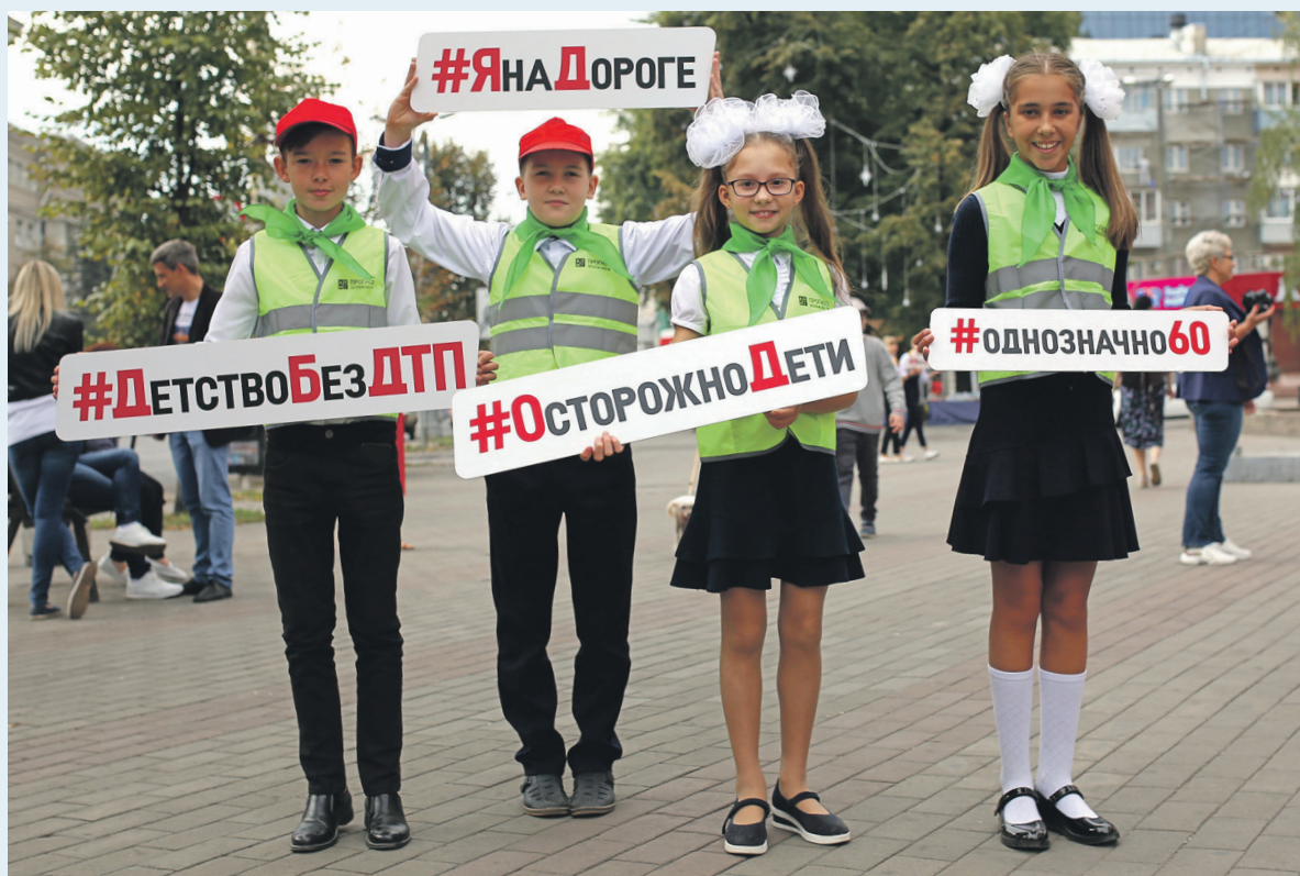
ЭЦ «Движение без опасности»

Почти две трети опрошенных (65%) считают, что на скорости более 60 км/ч ремень безопасности наиболее эффективен, а с утверждением, что непристегнутый пассажир на заднем сиденье