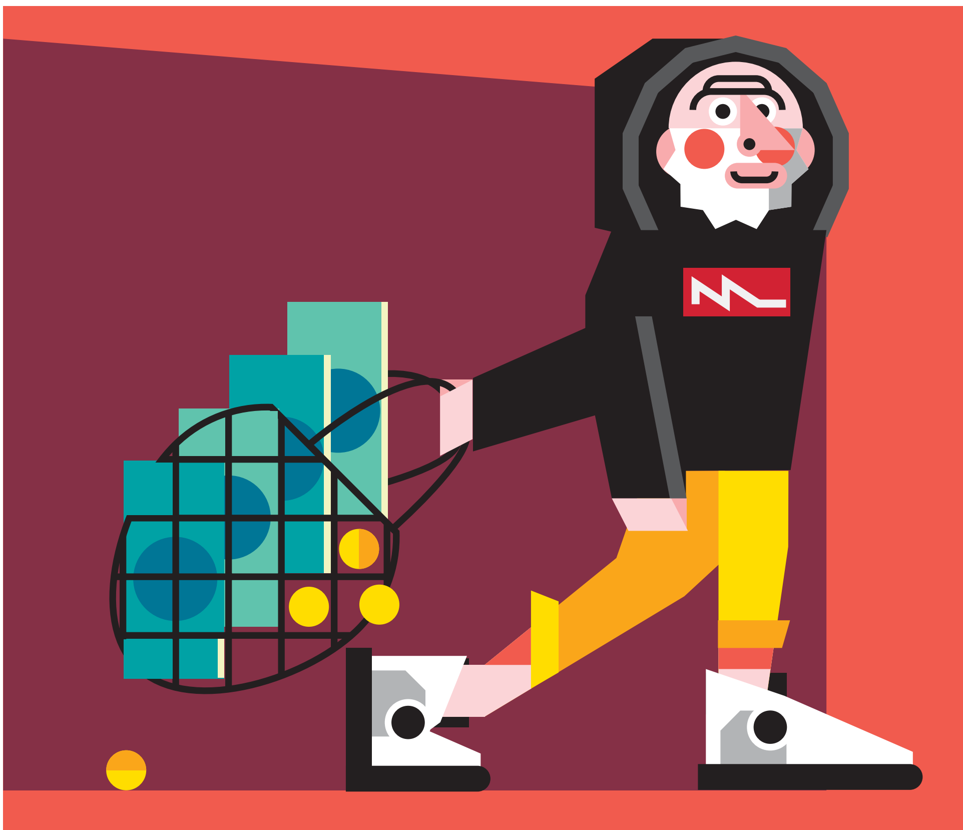
Иллюстрация: Тим Яржомбек для РБК

«Центр развития порто- вой инфраструктуры» стал совладельцем «Алтайвагона»