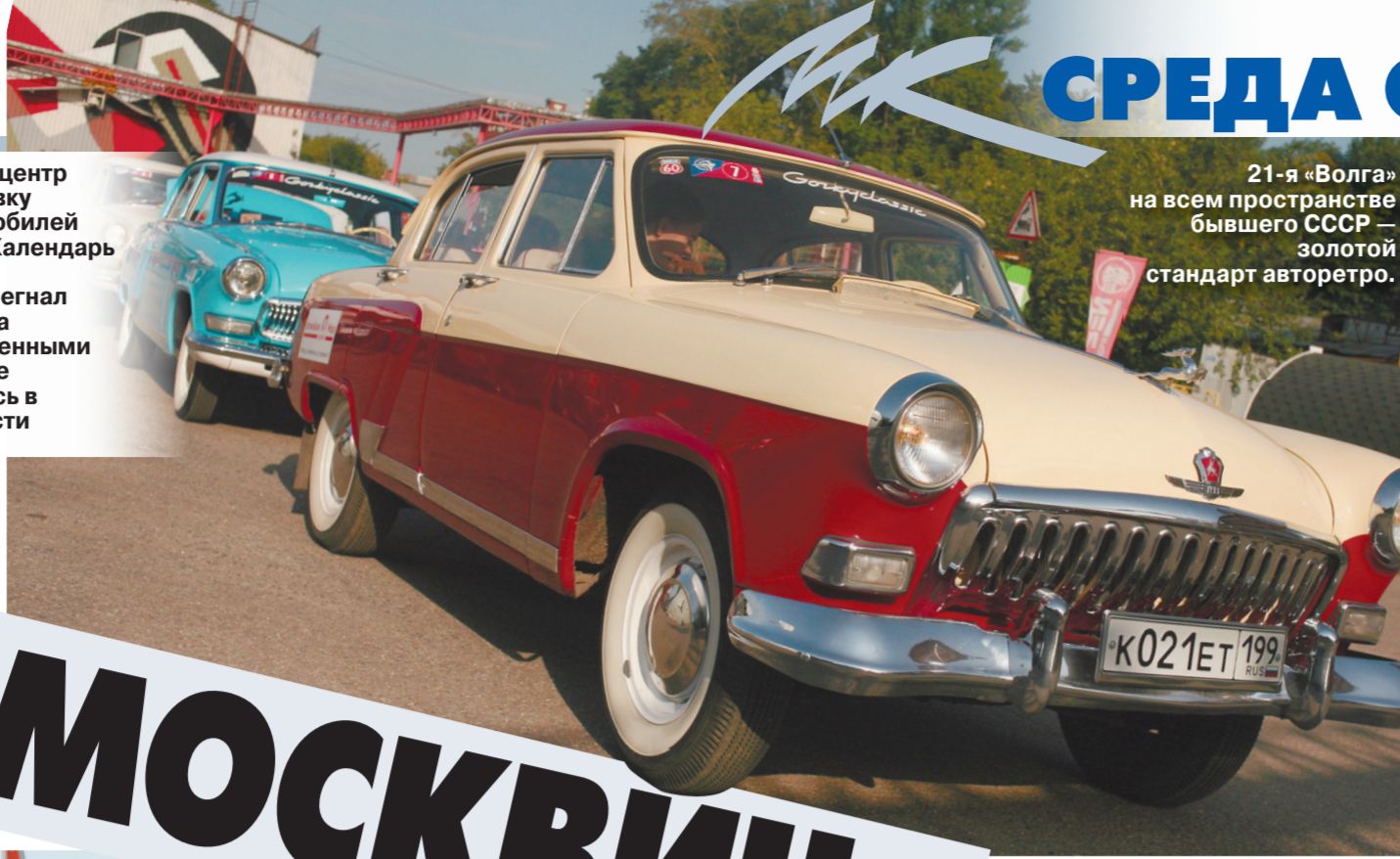
21-я «Волга» на всем пространстве бывшего СССР — золотой стандарт авторетро.

Несколько раз в год — в теплый сезон — центр Москвы вечером превращается в выставку красивых, отполированных ретроавтомобилей (чаще всего — от 30 до 70 лет от роду).