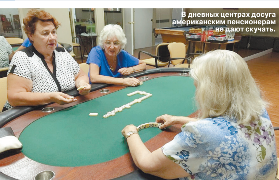
В дневных центрах досуга американским пенсионерам не дают скучать.