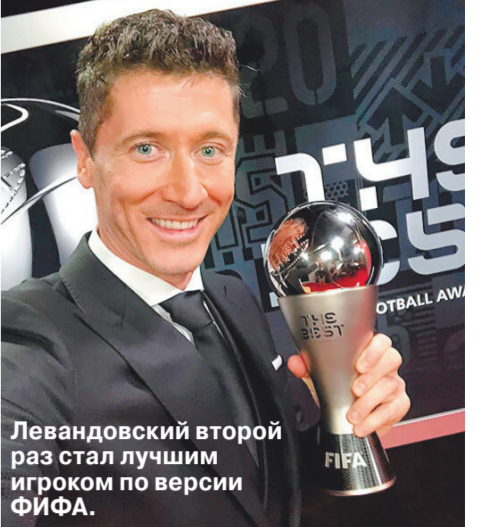
Левандовский второй раз стал лучшим игроком по версии ФИФА.

Церемония награждения состоялась в штаб-квартире организации в швейцарском Цюрихе и прошла в онлайн-формате.